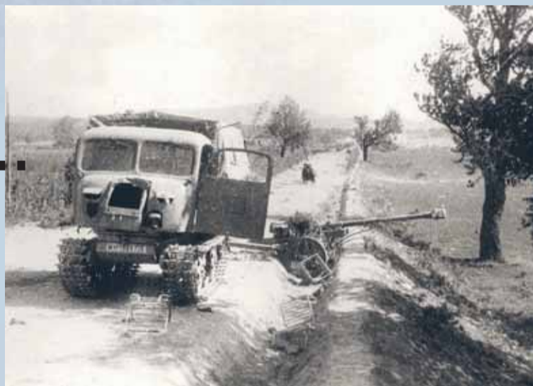
Produkowane w Austrii ciągniki Raupenschlepper Ost (RSO) na froncie wschodnim.