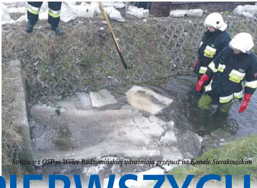
Strażacy z OSP w Wólce Radzyńskiej udrażniają przepust na Kanale Sierakowskim

W wyniku nagromadzenia w styczniu dużej ilości śniegu, wraz z ociepleniem pogody nastąpił znaczny wzrost stanów wód rzek i cieków wodnych na terenie gminy Nieporęt.