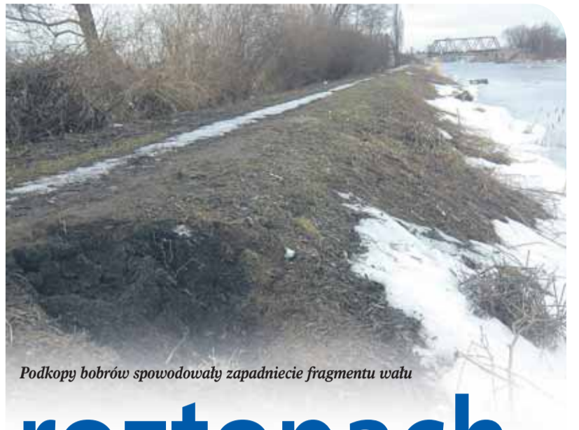
Podkopy bobrów spowodowały zapadnięcie fragmentu wału